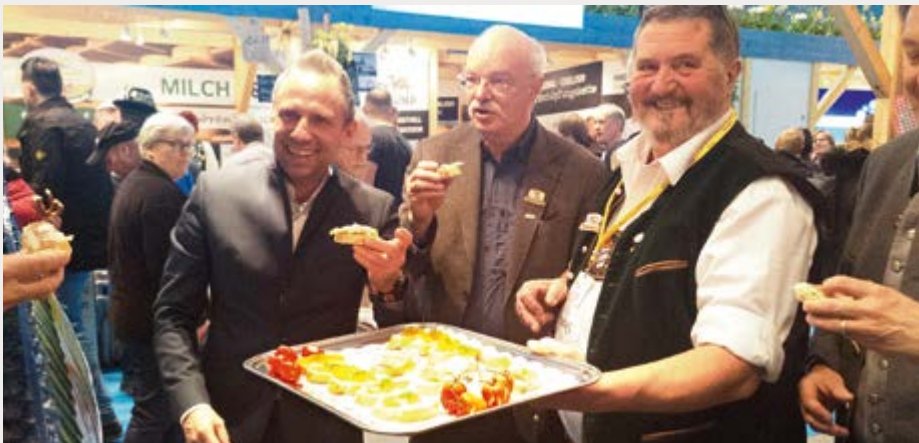
Beim Besuch von Umweltminister Thorsten Glauber gab es köstliche, bayerische Fischspezialitäten vom Institut für Fischerei der Landesanstalt für Landwirtschaft zu probieren.