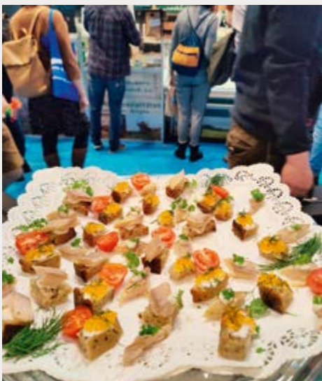
Die Messebesucher konnten Räucherfisch, Saiblings- und Forellenkaviar probieren und sich von der Qualität bayerischer Fischprodukte überzeugen.