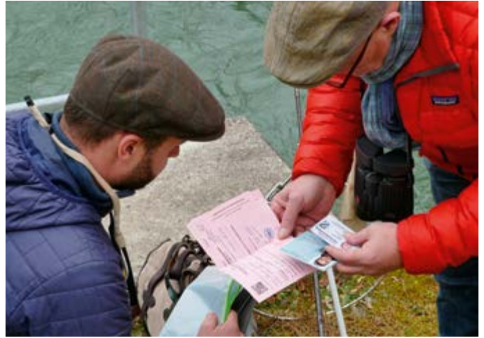
Angelerlaubnis und den Staatlichen Fischereischein sollte man immer im Original dabei haben.

Neben der Fischwilderei gibt es leider auch immer wieder innerhalb der Vereine schwarze Schafe, d.h. Fischereibe-rechtigte oder Gastfischer die es, bewußt oder unbewußt mit den Regeln nicht so genau nehmen. Wenn dann zufällig ein Fischereiaufseher auftaucht, Verstöße oder Nachlässigkeiten moniert, verwarnet oder gar die Erlaubnis ein-zieht, ist er in nicht wenigen Fällen der Buhmann, der anderen die Ausübung ihres Hobbys verleidet., wird be-schimpft oder schlimmstenfalls sogar bedroht.