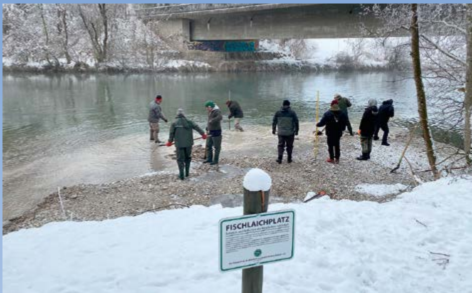
Aktives Engagement für den Umweltschutz: Fischer schaffen Laichplätze

Bereits nach dem erstmaligen Einbringen von Kies durch das Wasserwirtschaftsamt im letzten Jahr konnte der Erfolg dieser Maßnahme beobachtet werden: Auf den neu geschaffenen Kiesbänken laichten Äschen und Barben.