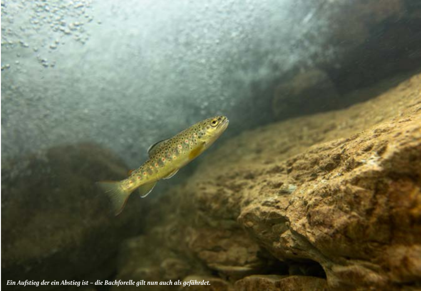
Ein Aufstieg der ein Abstieg ist – die Bachforelle gilt nun auch als gefährdet.