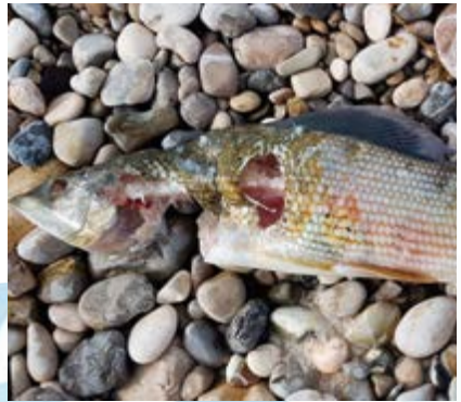
Die rasch größer werdende Fischotter-Population hinterlässt deutliche Spuren..