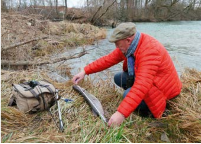
Der Aufseher kontrolliert, ob der gefangene Hecht das gesetzliche Schonmaß hat.