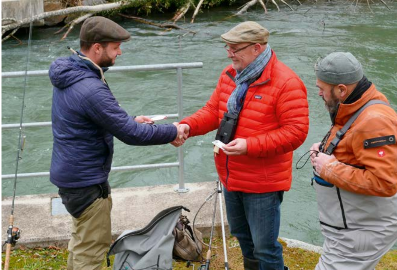
Kontrollen sollten stets mit der gebotenen Höflichkeit von beiden Seiten durchgeführt werden. Der Aufseher ist dabei der Partner der Fischer.